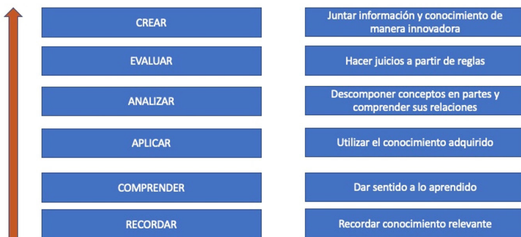
Figura 1: Taxonomía de Bloom. Nivel cognitivo

La idea central de esta taxonomía es establecer cuáles son los objetivos educacionales. Tienen una estructura jerárquica que va del más simple al más complejo o elaborado. Cuando los educadores elaboran programas han de tener en cuenta estos niveles y, mediante las diferentes actividades, ir avanzando progresivamente de nivel hasta llegar a los más altos y complejos (Fig.1), desde simplemente recordar conocimientos hasta analizarlos, evaluarlos y crear otras estructuras.