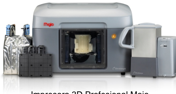
Impresora 3D Profesional Mojo