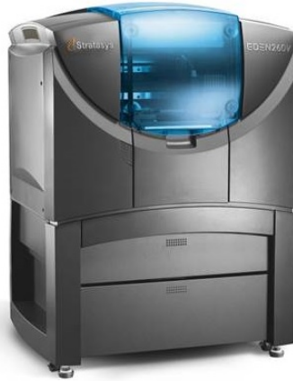
Impresora 3D Profesional Objet Eden 260