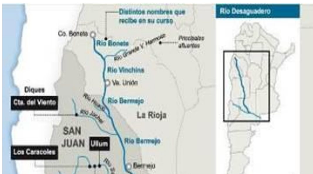
Fig. 1: Ubicación del Río Bermejo o Vinchina

Los análisis existentes realizados por la Dirección de Minería de La Rioja, en la década del 80, revelan que el contenido de Boro del agua en el Río de la Troya, principal afluente del Río Bermejo, es de 2,165 mg/l. Este valor disminuye paulatinamente hasta llegar al dique Los colorados.