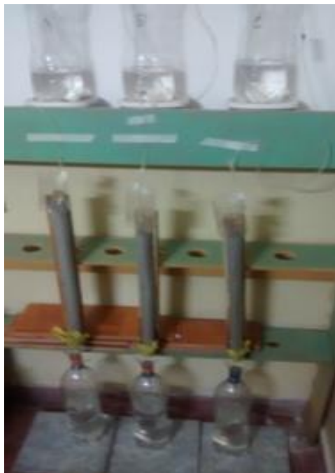
Figura 4: columnas de intercambio iónico para adsorción de Boro

Como lixiviante se utilizó, en primera instancia, agua recolectada del Rio Bermejo en septiembre de 2016 y luego en marzo de 2017. La velocidad de goteo inicial fue de 5 ml/min, pero por colmatación de la columna tuvo que disminuirse a 3 ml/min. El ensayo se realizó durante 3 días tomando una muestra del lixiviado de cada una de las columnas en forma diaria. Las muestras se enviaron para su análisis y de