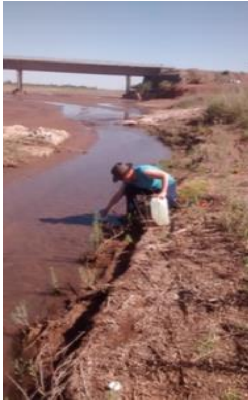
Figura 3: recolección de agua del Rio Bermejo en verano.