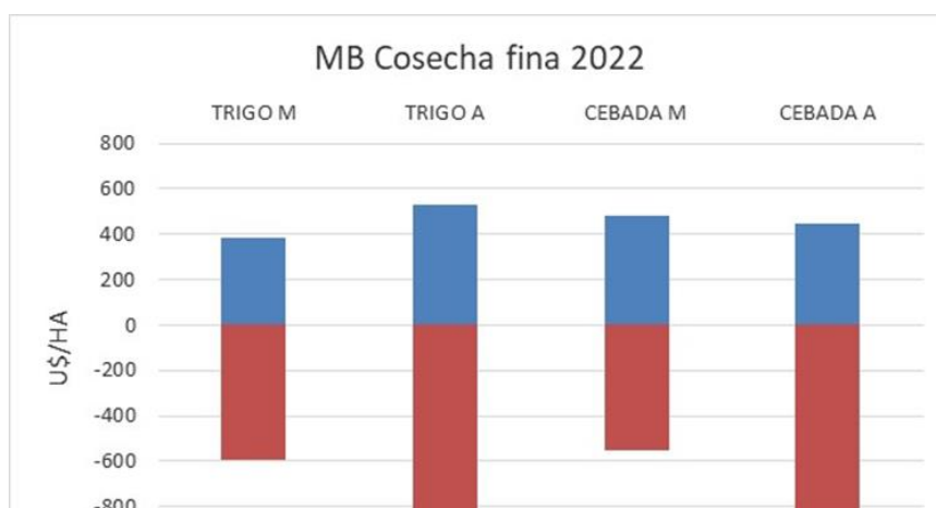
Figura N°1: Márgenes brutos para dos niveles de intensificación, medio y alto.

utilizadas. También, analizado de otro modo, que bajo las actuales condiciones es factible de utilizar dosis de fertilizante que mantengan el nivel de fertilidad, manteniendo márgenes positivos.