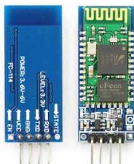
Figura 5: Módulo Bluetooth.

La figura 5 muestra un sensor de comunicación con tecnología bluetooth indispensable para vincular la información obtenida de los sensores y el hardware genérico.