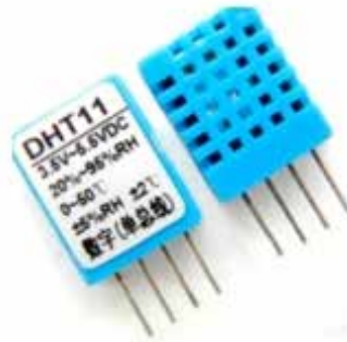
Figura 6: Módulo DHT11

El software encargado de configurar el funcionamiento del hardware genérico Arduino contempla la posibilidad de incluir librerías en el manejo y control de una variedad extensa de sensores y actuadores, facilitando la comunicación entre los diferentes sensores digitales. En la figura 6 se visualiza el sensor denominado DHT11 utilizado para adquirir datos de temperatura y humedad relativa.