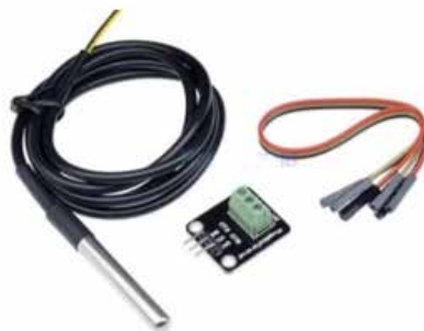
Figura 2: Sensor de temperatura

Puede realizar tareas de control y mediciones analógicas empleando un programa escrito de alto nivel (Yusuf, 2019). La innovación en el empleo de dispositivos genéricos Arduinos, es la incorporación de un software flexible y código fuente abierto facilitando la transferencia de información entre dispositivos mediante protocolos de comunicación SPI, I2C, RS232 y antenas inalámbricas. Se utiliza un transductor denominado sensor sumergible módulo DS18B20 como se muestra en la figura 2.