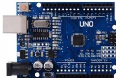
Figura 1: Arduino UNO

El Arduino Uno (Acakpovi, 2019) y (Rao, 2019) es un desarrollo electrónico de bajo presupuesto basado en un hardware flexible y fácil de usar, figura 1. Está pensado para artistas, diseñadores, como hobby y para cualquier interesado en crear objetos o entornos interactivos.