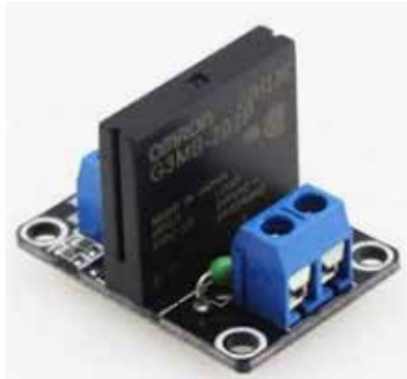
Figura 3: Módulo Relé de estado sólido

En la figura 3 se visualiza un relé electrónico que facilita el manejo y control de potencia denominado relé de estado sólido.