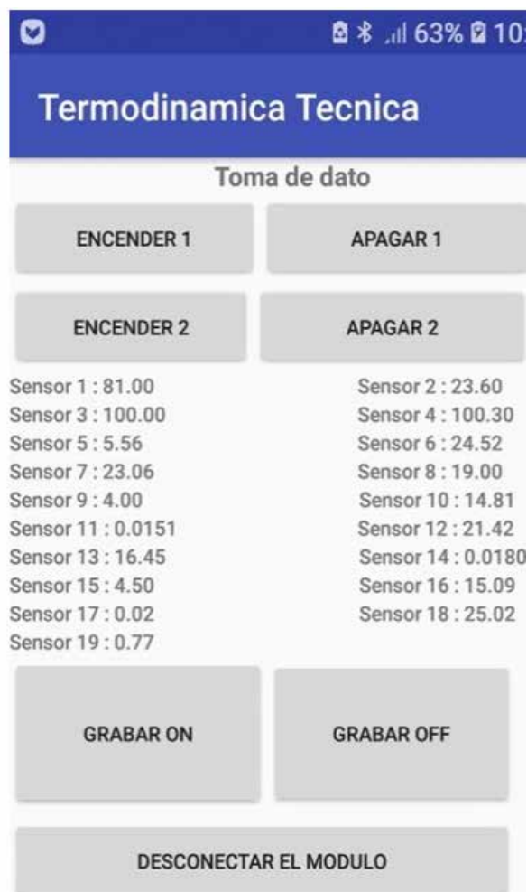
Figura 7: App desarrollada para el laboratorio remoto