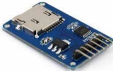
Figura 4: Sensor de Memoria

En la figura 4 se muestra un sensor encargado de almacenar en tiempo real las variables de estados termodinámicas de la experiencia de laboratorio.