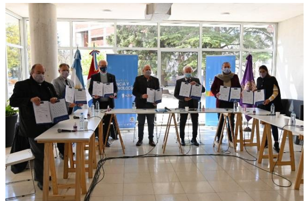
Figura 2. Creación del Córdoba Blockchain Hub.

En el año 2021 se formalizó su creación mediante Resolución del Ministerio de Ciencia y Tecnología. Nuestra Facultad es uno de los integrantes de este Hub y es representado por nuestro laboratorio (ver Figura 1 ).