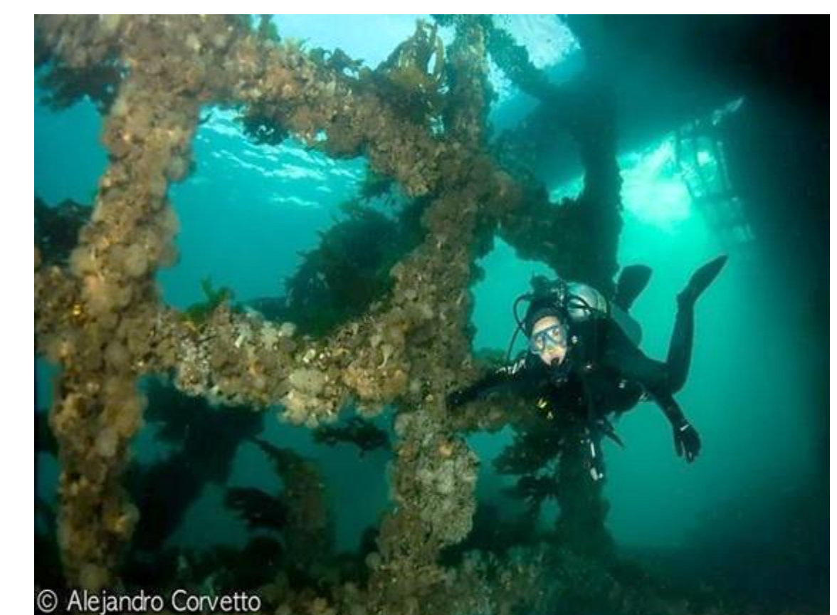
Fig. 4 Parque submarino "El Foliás" Puerto Madryn, Argentina