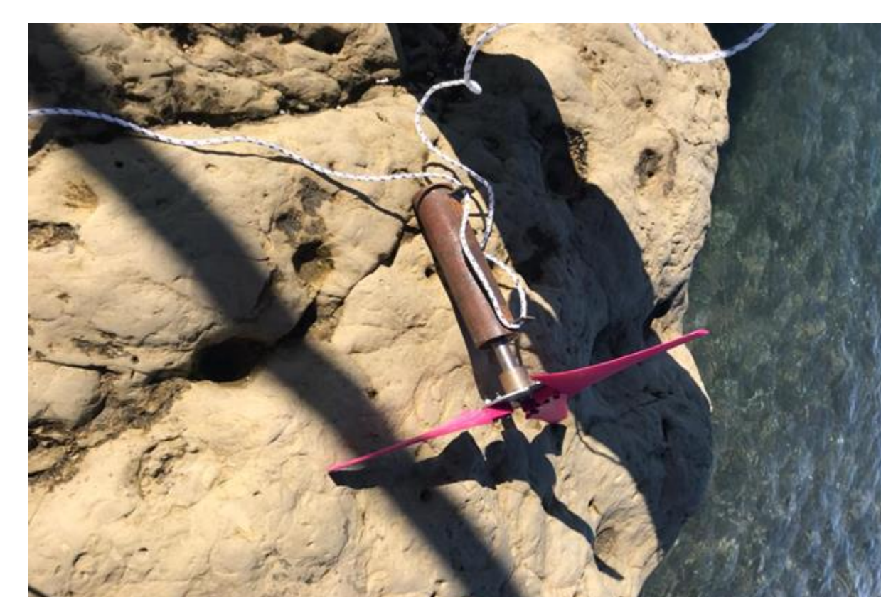
Fig. 5 Dispositivo sumergido en agua de mar