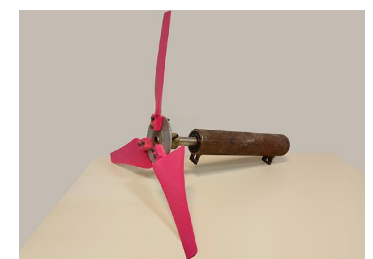
Fig. 6 Dispositivo experimental