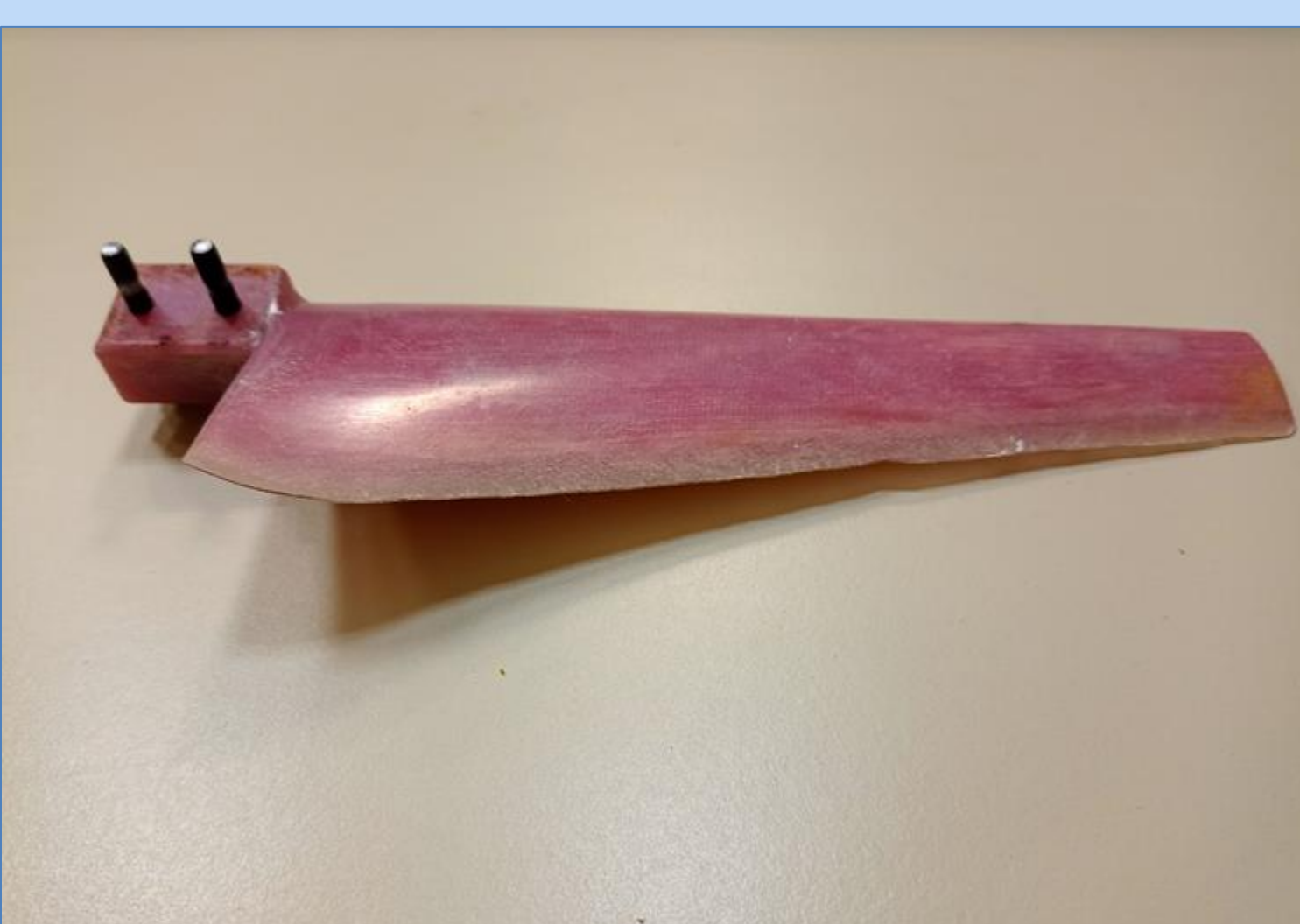
Fig. 1 Aspas polímero-fibra de vidrio

Los resultados obtenidos permiten avanzar a la siguiente etapa, la preparación de la superficie de aspas y carcasa mediante la aplicación de pintura antifouling para la protección del dispositivo. Posteriormente, el dispositivo será acoplado a un sistema de transmisión conectado a un motor trifásico y un variador de velocidad con el fin de exponerlo al ambiente marino a diferentes velocidades.