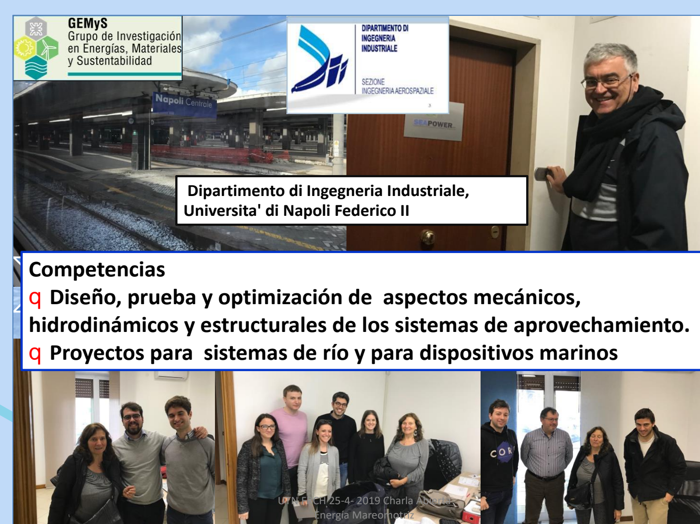
Fig. 2 Grupo de investigación Universidad de Nápoles