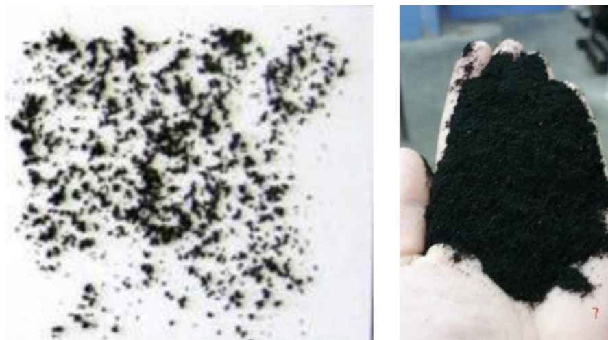
FIGURA 3 Muestra de NFU

Araujo et al. (2014), realiza un exhaustivo estudio para analizar el ciclo de vida de un pavimento tipo, referido a un tránsito estándar; el cual modeliza a partir de las propiedades básicas de los materiales constituyentes, como lo son el módulo y su relación de poisson, etc., En base al estudio se determina que la incorporación de residuos, como RAP, a la mezcla asfáltica reduce drásticamente las emisiones de gases en casi un 40 % en comparación con una mezcla en caliente convencional en su fase constructiva.