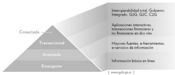
Fig. 1: Etapas de desarrollo del Gobierno digital según las Naciones Unidas (Gobierno de Costa Rica, 2012)

De acuerdo a la clasificación de la Fig. 1, en el año 2007 cuando nuestro país estaba en la etapa “Emergente”, junto con veinte gobiernos latinoamericanos y España recomendaron en “Carta Iberoamericana de Gobierno Electrónico”: “el uso de estándares abiertos y de software libre en razón de la seguridad, sostenibilidad a largo plazo y para prevenir que el conocimiento público no sea privatizado” (CLAD, 2007) y luego, en una etapa “Avanzada”, suscriben un “Modelo Iberoamericano de Software Público para el Gobierno Electrónico”. En este modelo se menciona como una de sus premisas, las experiencias del gobierno federal brasileño al “tratar al software como un producto acabado que llega a la sociedad con documentación completa de instalación, y preparado para funcionar, como cualquier software” (CLAD, 2010).