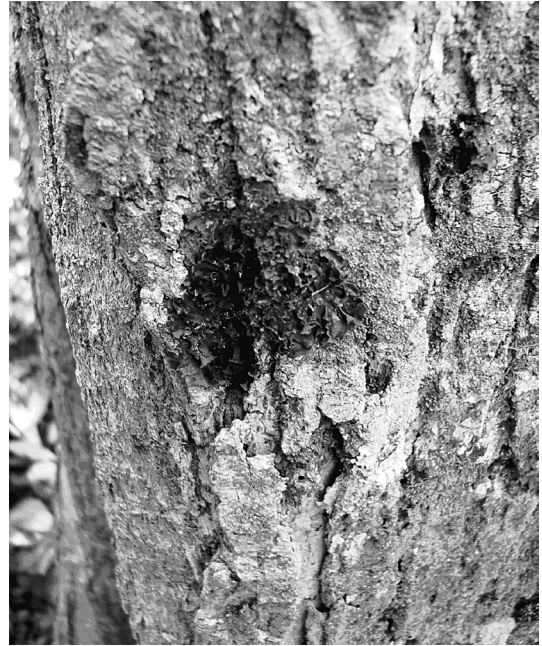
Fig 1. Leptogium brebissonii

Talo folioso grisáceo ciliado, soralios marginales,