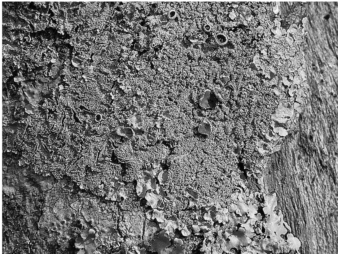
Fig. 3. Punctelia constantimotium

2002) y presenta una distribución casi en toda Sudamérica, por lo que es muy probable que se encuentre en otras provincias.