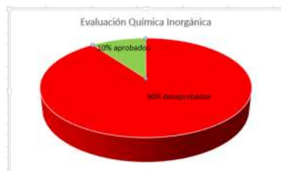
Fig. 2, Alumnos que rindieron el primer parcial de la asignatura (Año 2017)