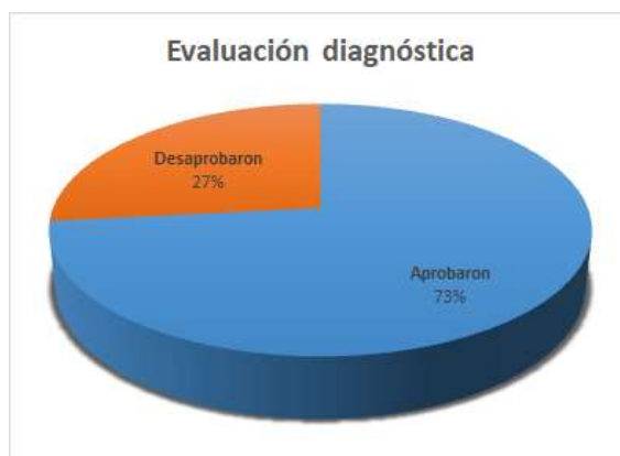
Fig. 4, Porcentajes de la evaluación diagnóstica (Año 2018)