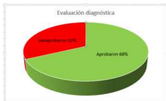
Fig. 1, Porcentajes de la evaluación diagnóstica (Año 2017)