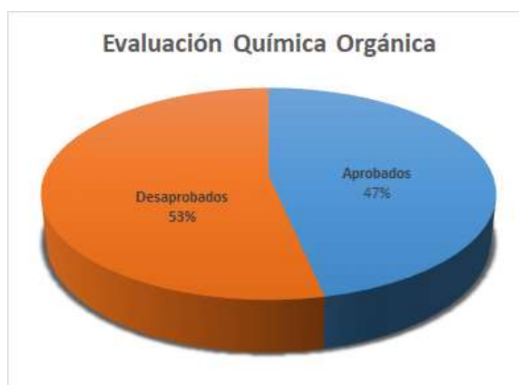
Fig. 6, Alumnos que rindieron el primer parcial de la asignatura (Año 2018)

A partir de los últimos resultados expuestos se puede decir que hubo mejora en cuanto al rendimiento de los alumnos y que puede asociarse a la metodología empleada durante el dictado de los contenidos curriculares.