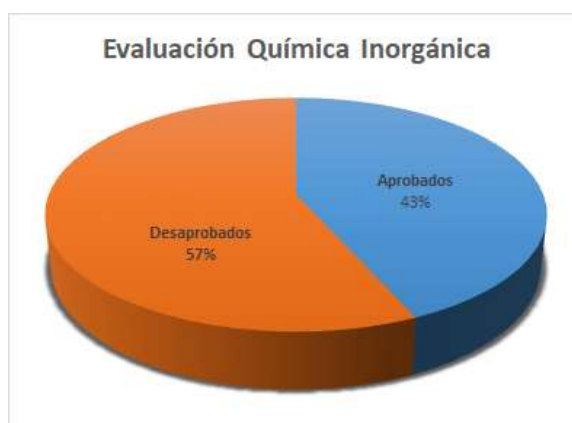
Fig. 5, Alumnos que rindieron el primer parcial de la asignatura (Año 2018)